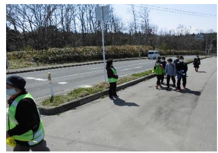
(上 野 交 差 点)