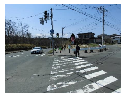
(上 野 交 差 点)