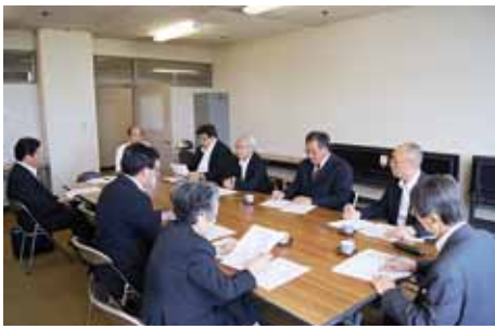
議会改革特別委員会の様子

委員会としては、開かれた議会を目指す上でも議論しながら、議員一人ひとりの資質を高め、多くの現場に向き、町民の声を聞き、議会基本条例の制定に向けて議会改革を進めて行きます。