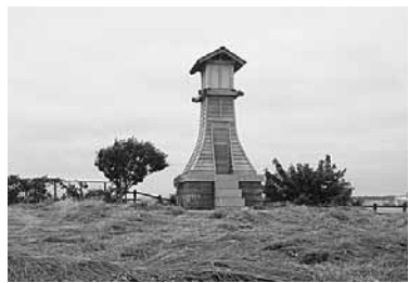
草刈り後の天童山公園

天童山公園については、若干時期が遅くなつてしまいいま6月22日に公園付近全体の草刈りを行うことにしています。年2回