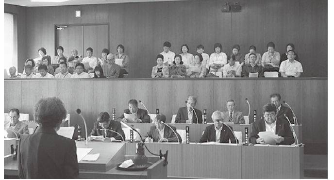
定例会の一般質問にはたくさんの方が傍聴に訪れました