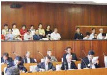
一般住民、町職員の傍聴者