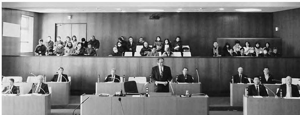
平日開催より多くの町民が訪れた日曜議会（一般質問）

町議会では、議会改革の一環として、平成27年、28年に夜間議会を開催し、住民の傍聴機会の拡大に努めてきました。今回は、平日傍聴に來られない方のために、初めて日曜議会を開催し、4人の議員が一般質問を行いました。傍聴者のうち初めて傍聴された方が約3割と効果がみられました。今後の日曜議会の開催については、時期等を含め検討していくこととしています。