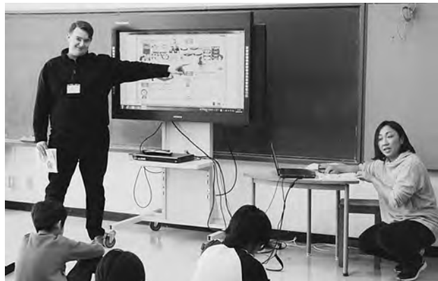
小学校5年生の英語科授業の様子

そこで今年度と来年度の2カ年を移行期間として、中学年3・4年生の外国語活動（英語活動）を年間15時間、高学年5・6年生では外国語科（英語科）ということとで教科として年間50時間を実施することとされて