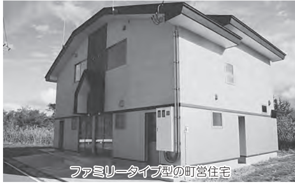
ファミリータイプ型の町営住宅