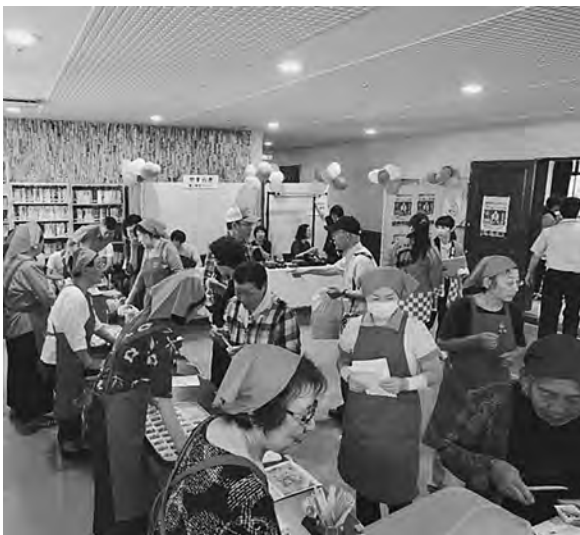
年1回開催のあじがさわ健康フェスティバル (写真は、食生活改善推進員の野菜たっぷり・減塩メニュー紹介コーナー)