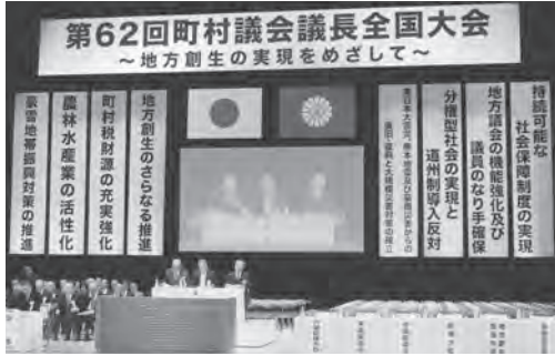
全国大会の議事の様子

11月21日、NHKホー ルにおいて、全国の町村 議会議長が一堂に会し、 町村議会議長全国大会が 開催されました。 大会では「地方創生の 実現をめざして」をテー