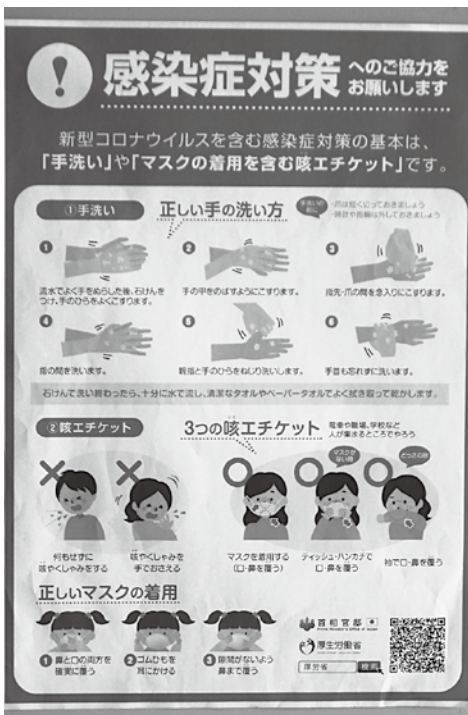
町が感染症対策のため毎戸配布したチラシ

問・私は、感染症予防を野辺地慶三先生から学び実践していますが、手を洗う、水分を取る、体の