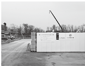
写真：建設中の新庁舎

旧鱒ヶ沢第一中学校グラウンド跡地に建設中で、令和3年3月に完成予定の新庁舎建設事業