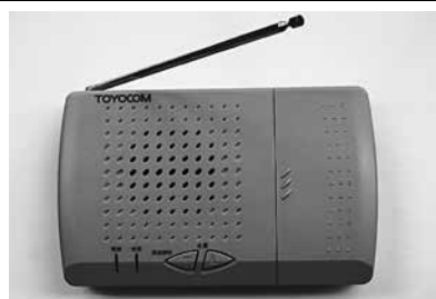
現在使用されている戸別受信機

平成2年度中でのデジタル化へ向けた新しい防災行政無線の導入を進め、新庁舎の開庁に合わせ運用を開始する。