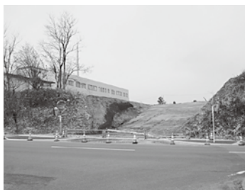
写真：鳴戸ヶ丘線道路

新庁舎完成にあわせて消防庁舎裏手を通り、国道101号バイパスへつながる道路の改良事業