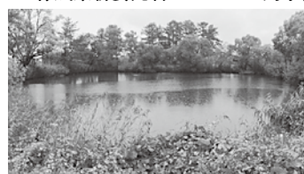
写真：浸水想定区域図作成を予定しているため池

決壊した場合の影響が大きいため池について、緊急時の避難経路、避難場所等を示したハザードマップの作成委託料