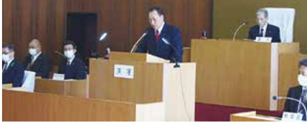
就任のあいさつをする神議長（写真中）と臨時議長を務めた世永議員（写真右奥）