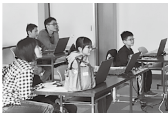
写真：写真はイメージです。 (公民館事業 親子プログラミング教室)

町内小中学校の児童生徒が使用する学習用ICT機器（タブレット端末）の購入及び整備等事業