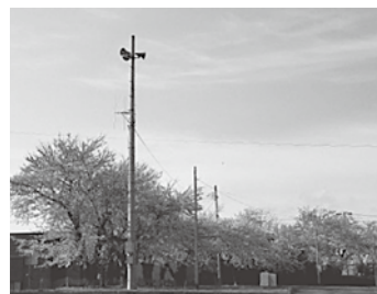
写真：現在設置されている屋外拡声子局

アナログ無線の使用期限が令和4年11月末までとなっているため、防災情報システム（親局設備、屋外拡声子局、戸別受信機等）を更新する事業