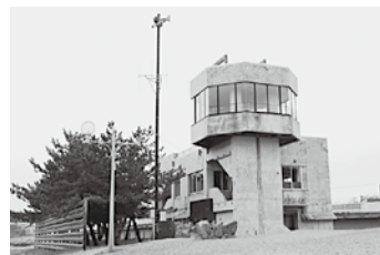
写真：解体予定のはまなす会館