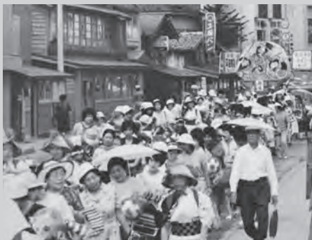
～昭和50年代～ 地域の方を巻き込んだ大行列 見物人も大勢いました

感染症対策のため、鯉ヶ沢こども園前から旧町役場駐車場までと、距離を大幅に縮小。全園児わずか15名ですが、卒園児や地域の方々も一緒にねぶたを引き、最後の運行に華を添えてくれました。