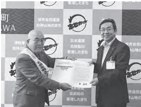
犯罪や非行のないまちを目指します