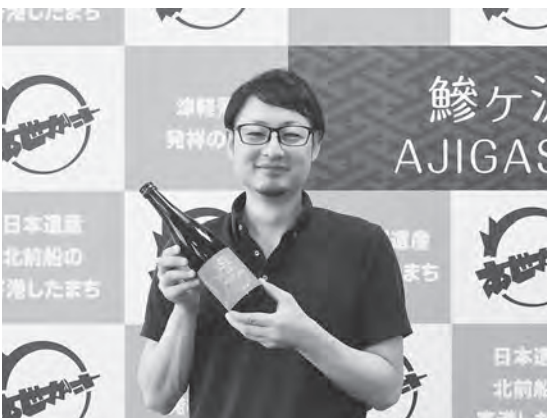
大きく入った「勝」の字と濃いピンクのラベルが目印