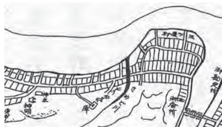
慶安の鯺ヶ沢絵図より 「七ツ石村」と「三ツ屋村」部分

こうして、周辺の村やそこに住む農民・漁師らを取り込む形で、近世の鯺ヶ沢町は形づくられていったのです。（青森工業高校 葛谷大輔）