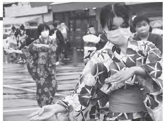
雨にも負けず最後まで踊りました