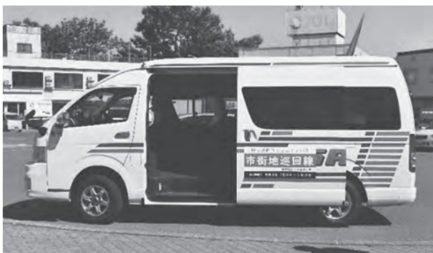
あじバス市街地巡回線

間限定で実施され、同時に利用者アンケートを行いました。令和3年度からの本格運行には、実証運行で得られたデータや利用者の意見などをできるだけ反映し、役立てています。 市街地巡回線は、今年5月に移転した町役場新庁舎へのアクセス便としても利用されています。