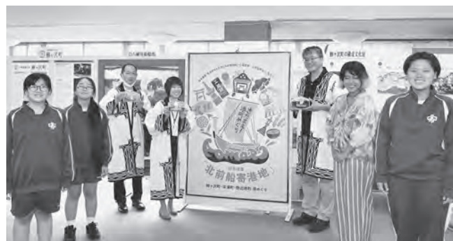
3町の担当者、PRイラストを作成した野辺地中美術部員とデザイナーが連携をPR（7月・野辺地町にて）

青森県で唯一の日本遺産「北前船寄港地」に認定されている鯺ヶ沢町・深浦町・野辺地町。江戸・明治時代に北前船が盛んに往来した3町には、船絵馬や石造物、祭りや食文化など、当時を物語る歴史文化遺産がさまざまな形で受け継がれています。