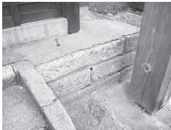
延寿院本堂の笏谷石の基壇

まずは、福井県福井市の足羽山一帯から切り出される「笏谷石」。濡れると美しい青色の石なので、町歩きですぐ見つけることができます。延寿院本堂の基壇、新地稲荷神社や神明宮の参道石段、墓地の古い墓石、一丁目の大