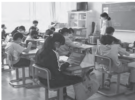
舞戸小のタブレット学習の様子

■寄附金活用事業の紹介 お寄せいただいた寄附金は、「あじがさわ未来応援基金」として1度積み立てた後、寄附者が選択した「産業の振興」、「教育文化の発展」、「健康福祉の増進」、「自治体にお任せ」の4つの使途に応じて、それぞれ関連した事業に寄附金を充当して活用しています。 令和2年度における寄附金の主な活用事業と概要は次のとおりです。 ▽小・中学校ICT教育推進事業 3968万円 令和2年度から必修化したプログラミング教育を行うため、児童生徒一人ひとりへのタブレット端末の購入、無線LAN環境の構築など、小・中学校のICT環境を整備しました。 小・中学校ではタブレット端末を有効活用し、プログラミング的思考を身につけるための授業が行われています。