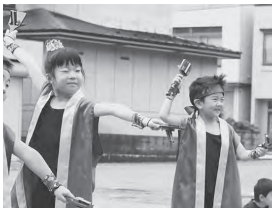
鳴子両手に「どっこいしょ！」