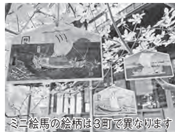
ミニ絵馬の絵柄は3町で異なります