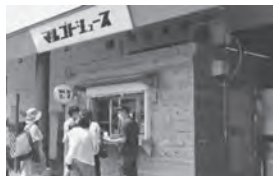
マルゴトジュース