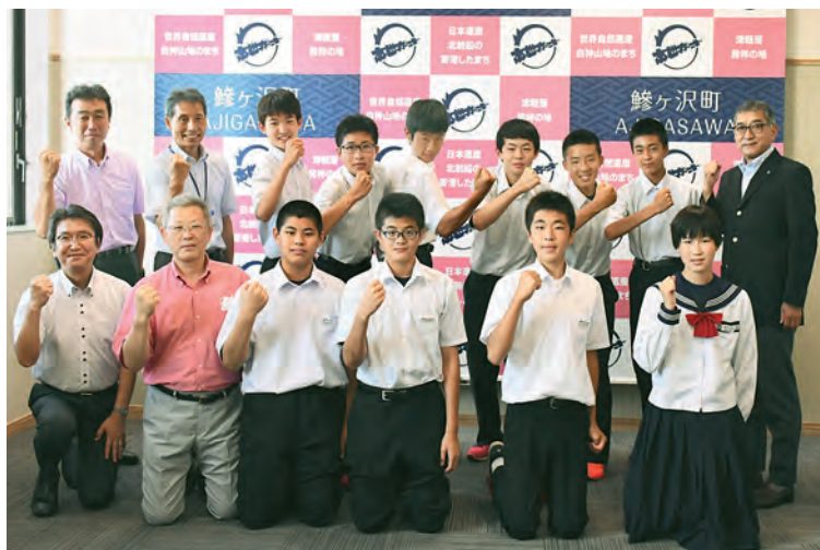
陸上部（後列）、相撲部（前列中央）、水泳部