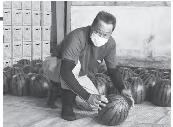
すいかを叩いて選別する今班長

7月後半からは、露地栽培すいかの本格的な出荷時期を迎え、例年9月上旬まで出荷されます。