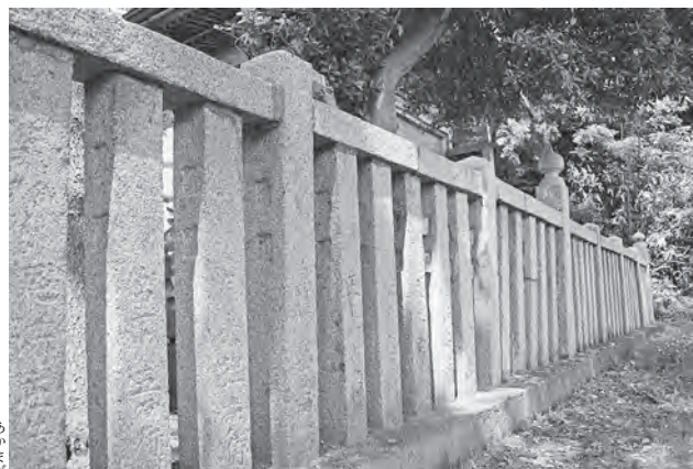
白八幡宮本殿の御影石の玉垣

白八幡宮本殿を囲む玉垣は、文化13年（1816）に建立された県下でも指折りの御影石製石造物です。玉垣の一本一本には、多数の大坂商人や、海運関係者とみられる塩飽（香川県丸亀