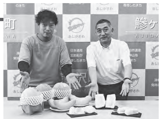
8月はメロンスイーツざんまい！

メロンスイーツは、海の駅わんど内のシーポップで8月1日から1か月間限定で販売されています。