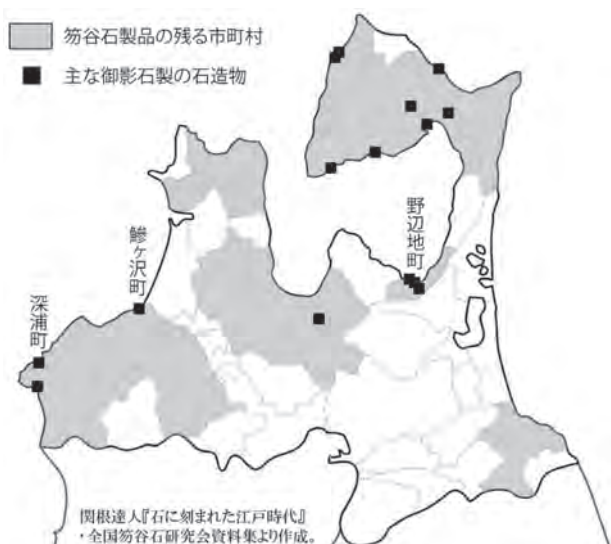
北前船が運んだ笏谷石・御影石の分布

瀬戸内から下関、そして日本海を通って鱈ヶ沢にたどり着いた遙かなる石の旅人たち。ひんやりとした石の手触りや、参道を歩く足裏に、ふと歴史の息づかいを感じてしまうのは、私だけでしょうか。(町学芸員 中田)