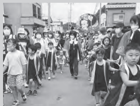
～令和3年7月11日～ 小規模ながらも 47回目となる最後の運行