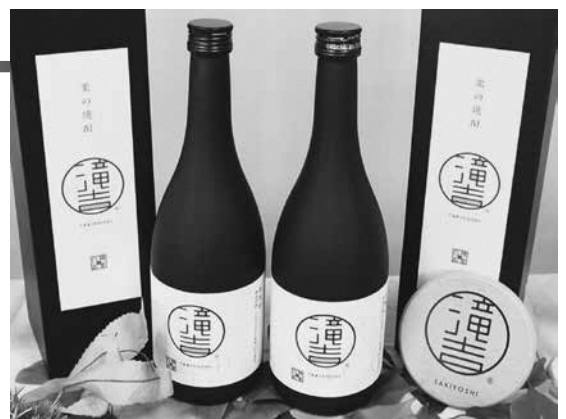
深谷の栗焼酎「滝吉」

深谷の栗焼酎「滝吉」（2700本限定） 価格▶2,700円(税込) 発売日▶5月1日(日) ※予約受付中 発売場所▶海の駅わんど内「シーポップ」(☎72-6661)