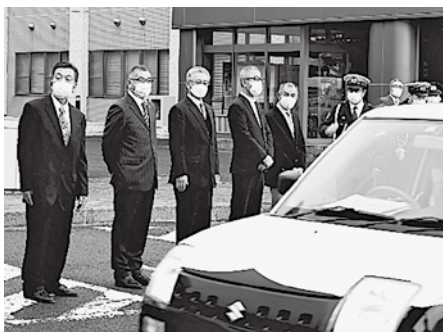
交通指導隊出発式の様子

4月6日から15日の10日間にわたり実施された「春の全国交通安全運動」では、関係機関の連携により町内各地で交通安全街頭指導が行われました。