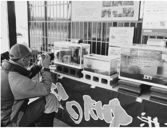
ハタハタの稚魚を撮影する町民