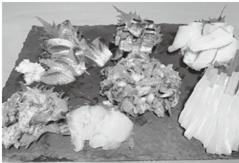
ヨロイタチウオの刺身（下段中央）