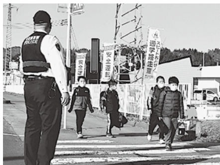
鱈ヶ沢警察署による登校児童への街頭指導