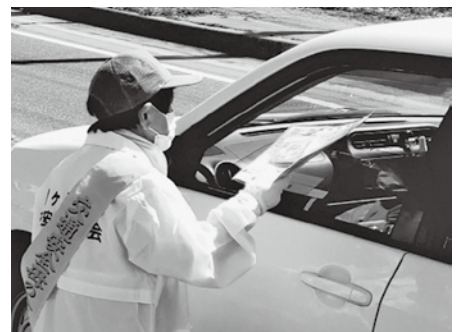
鱈ヶ沢地区交通安全協会が運転手にチラシを配布