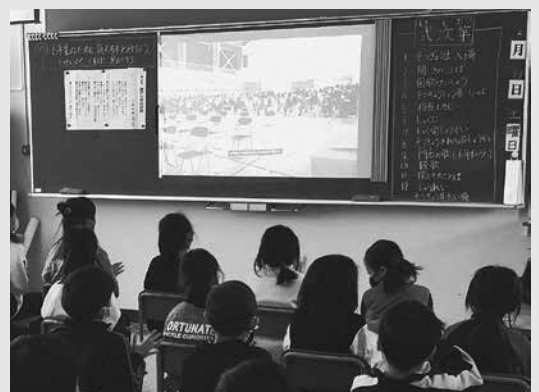
卒業式の映像を見ながら拍手をする2年生

町では令和3年度までに、児童生徒1人1台のタブレット端末、小中学校での高速インターネット環境を整備しました。今後もこれらのICT環境を有効活用し、個々の特性に応じた創造性を育む学習活動を積極的に推進していきます。