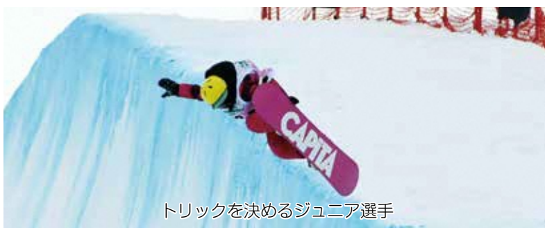
トリックを決めるジュニア選手