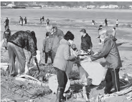
七里長浜海岸の清掃活動を行う参加者