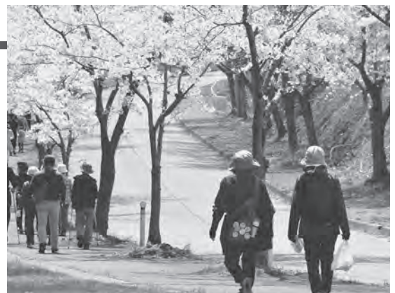
桜の下をウォーキングする町民