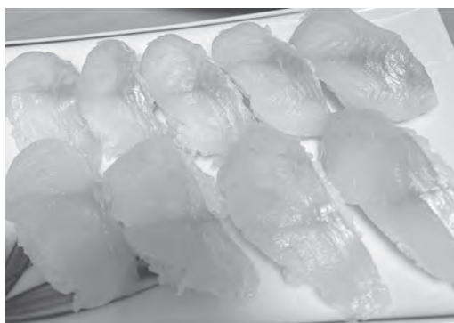
アイナメを寿司でいただきました

4月19日、漁師さんにお誘いいただき、これから始まる遊漁船のシーズン前の調査ということで、船釣りに行ってきました。昨年9月に同じ漁師さんと釣りに行った際は、マダイを筆頭にイナダやアイナメなどが爆釣でした。シーズン前とはいえ、秋にそれだけ釣れるなら今回もと期待しておりましたが、結果は漁師さんと我々協力隊の3人でわずか10尾程度と惨敗でした。まるで海に魚がいなくなったのかというくらい魚の反応がありませんでした。