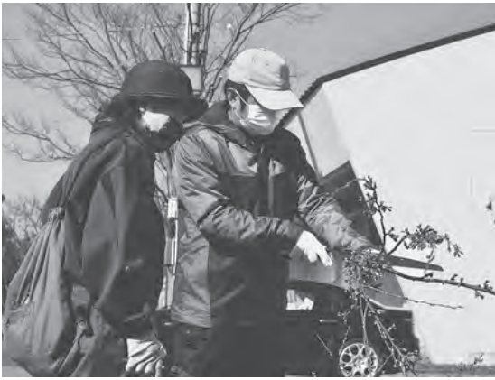
せん定した桜の枝を切り分ける会員