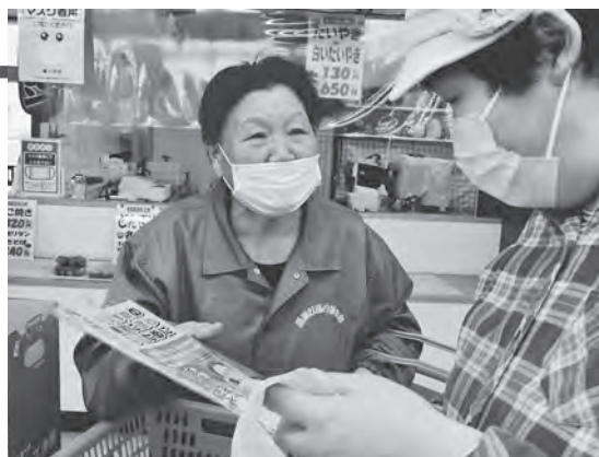
特殊詐欺防止の啓発活動を行いました

大会終了後は、町内のスーパーや駅前前で特殊詐欺や万引き防止の広報活動、自転車防犯診断を行い、防犯意識の向上を呼びかけました。