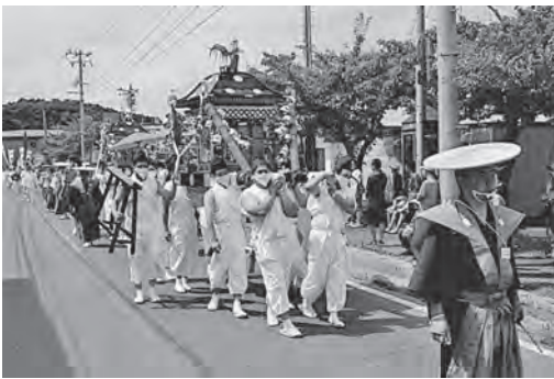
白八幡宮大祭の神輿渡御行列(平成29年) 行列の後に各町内の山車がお供する

ルーツとされる祇園祭が、本来は「疫病」(多数の死者を出す伝染病)を鎮める祭りだったことをご存じでしょうか。コロナ感染症に関心が集まるなか意外と知られていない疫病と祭りの関係や、白八幡宮大祭の本来の成り立ちについて探ってみたいと思います。