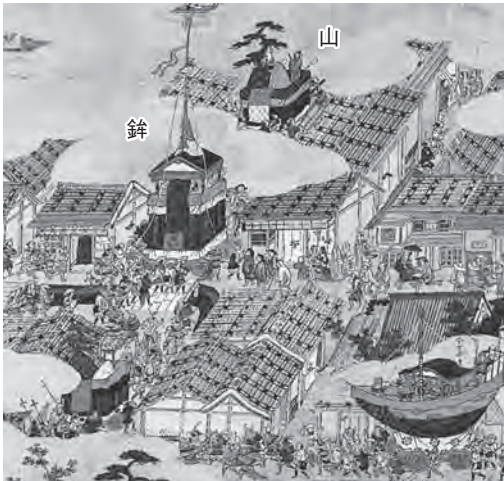
祇園祭の山鉦巡行(洛中洛外図屏風) 室町時代後期 『北前船と津軽西浜』より転載