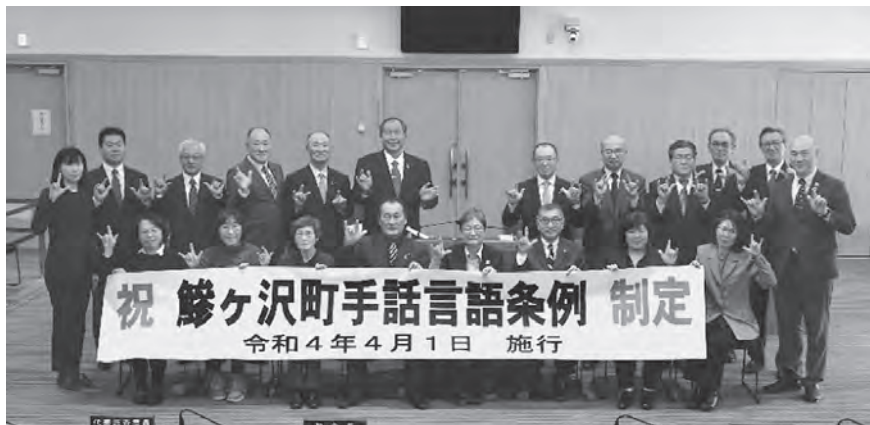
町議員と西北五ろうあ協会及び関係者が記念撮影