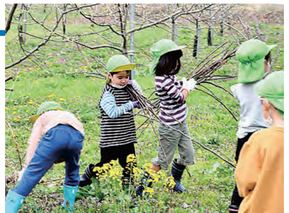
枝拾いを行う園児の様子

園児は今後、りんごの摘果や収穫作業などを行い、年間を通してりんごの栽培体験を行います。