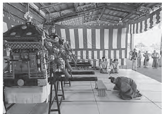
鯺ヶ沢漁港に設けられた御仮殿(平成25年) 夜には漁協や地域の氏子により宵宮が行われる

延宝5年(1677)、地域の安全や五穀豊穡を願い始まったとされる白八幡宮大祭も、祇園祭と同じ祭りの形態を今に伝えています。大祭では、町全体の守護神である白八幡宮と白鳥大明神の神様(御神体)を乗せた2基の御神輿に大勢の行列が従い、8月14日、16日の2日間をかけて町中をまわります。この時、御神輿を町内にお迎えする御旅所のことを、鯺ヶ沢では「御仮殿」と呼んでいます。