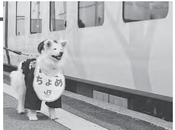
リゾートしらかみを歓迎するちよめ

ちよめは早速、今年、運行開始25周年を迎えた「リゾートしらかみ」の到着を歓迎し、可愛らしいちよめのお出迎えに乗客は拍手して喜んでいました。