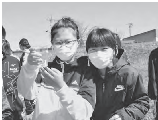
育てたサケの稚魚と記念写真