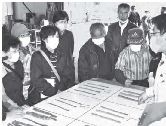
説明を聞きながら基準を確認する生産者