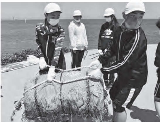
大きな漂着ごみも拾いました（舞戸小学校）