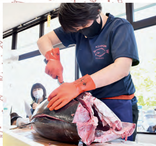
マグロ解体ショーは、地域おこし協力隊の見事な包丁さばきで大盛り上がり