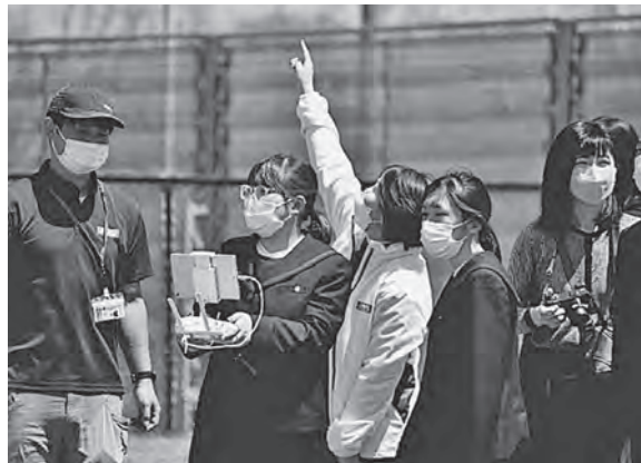
ドローンの操作体験の様子

見たりと、ドローンの魅力を存分に体感しました。最後には記念に、ドローンで集合写真を撮影しました。