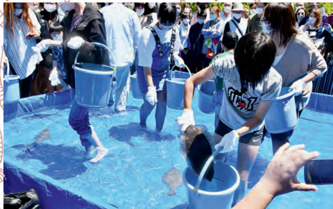
ヒラメのつかみどりでは、大人も子どもも夢中に