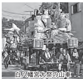
白八幡宮大祭の山車