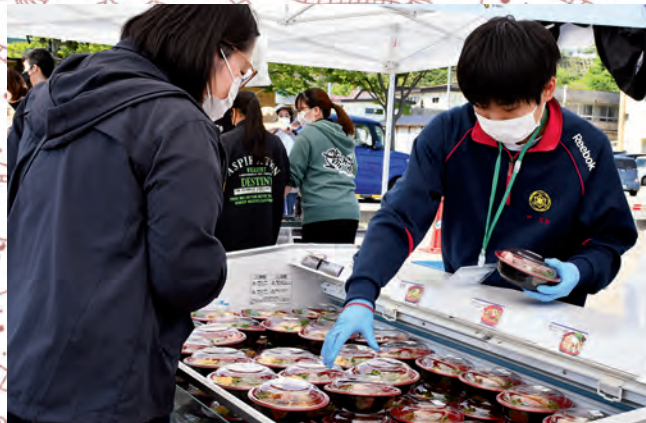
各店のツケ丼を見比べて買い求める来場者と、スタッフとして参加した鰯高生