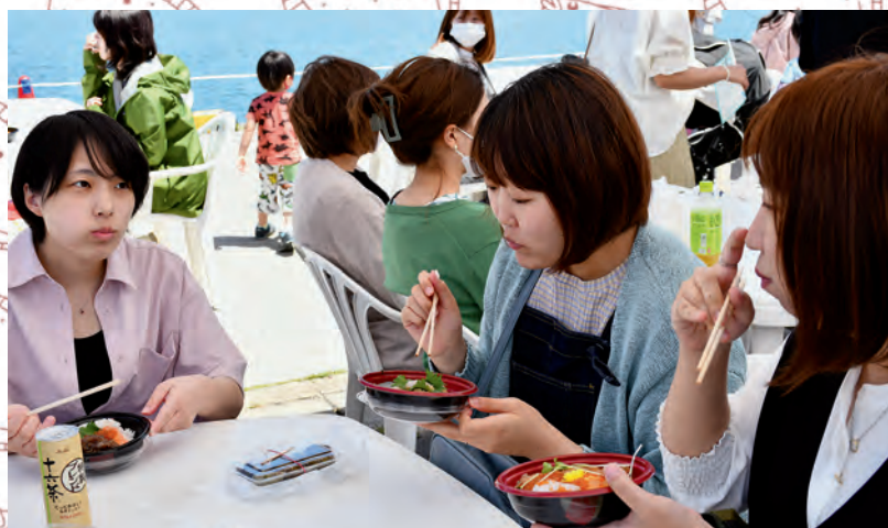
ヒラメのツケ丼を食べた方からは「ツケ具合が良く、おいしい」といった声が聞かれました

発行・編集 鰯ヶ沢町政策推進課 TEL07377711211 FAX07377711374