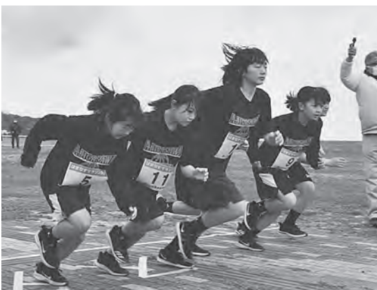
小学生女子スタートのようす