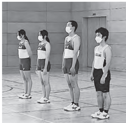
高校総体に出場した陸上競技選手

5月27日(金)～29日(日)、陸上競技部が県高等学校総合体育大会に出場しました。今年度、新入部員1名が加わった合計4名の選手それぞれが全力を尽くしました。また、出場に先立って高校総体壮行式を行いました。