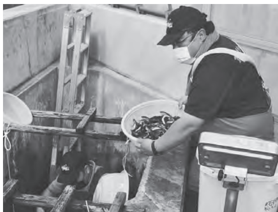
アユ稚魚積込作業のようす