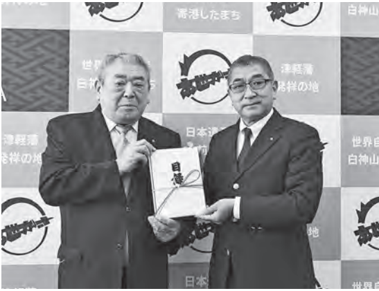
番場会長と平田町長