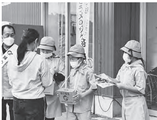
募金にご協力いただきありがとうございました