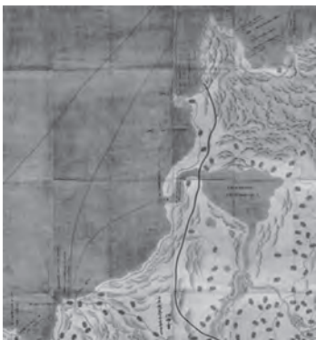
「陸奥国津軽郡之絵図」の鱒ヶ沢～十三湊部分 (青森県立郷土館蔵、画像は『青森県史 資料編 近世2 津軽1』口絵より転載)