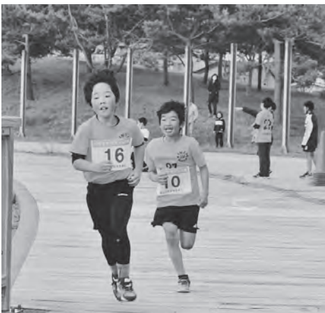
海風を浴びながら走る小学生男子