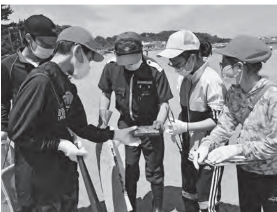
保安部職員と何ごみか相談（西海小学校）

漂着ごみの調査のあと、児童は、青森海上保安部の職員から外国で捨てられたごみが鱒ヶ沢町の砂浜に漂着するまでの経路や、海上保安部の仕事を学びました。