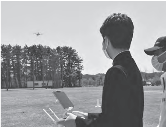
教わりながらドローンを操縦する生徒