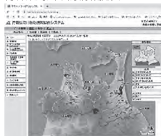
青森県河川砂防情報提供システム

NHK総合にチャンネルを合わせる ↓テレビリモコンの「dボタン」を押す ↓TOPメニューの「防災・生活情報」を選ぶ、決定ボタンを押す ↓「河川水位情報」を選択する