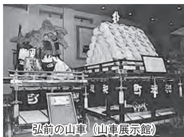
弘前の山車(山車展示館)