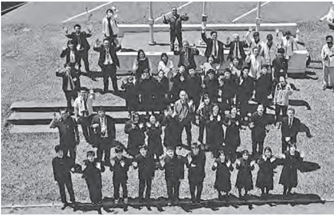
ドローンで撮影した集合写真

5月10日(火)、本校の第一体育館とグラウンドにおいて、今年度第1回目となる鱈高みらい塾が行われました。弘前市にあるJUA V A C ドローンエキスパートアカデミー青森校より講師をお招きして、ドローンが注目されている分野や操縦に関する注意点を学びました。体育館での講義後、4つの班に分かれた生徒は講師の指導を受けながら操作を体験しました。また、飛行するドローンのカメラからの映像を