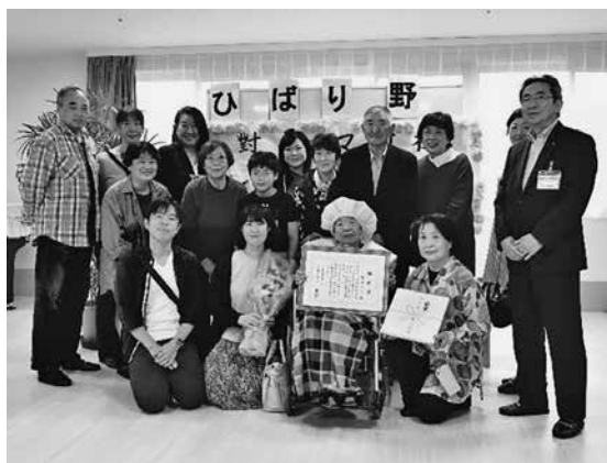
對馬さん（中央）を囲むご家族と副町長（右）