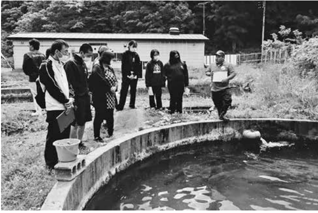
町の産業の魅力を改めて感じました

午前は、長谷川自然牧場、ABI T ANI A ジャーゾーフーム、海の駅わんど、マルゴトジュース、銘菓の店山ざきを訪れ、午後は、アユ・イトウ養殖施設、いかやの由利を見学させていただきました。