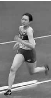
力走する選手 (男子・女子陸上部)