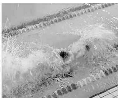
力の限り泳ぐ選手 (水泳部)