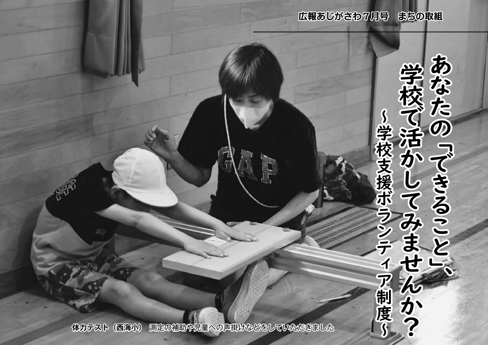
体力テスト（西海小） 測定の補助や児童への声掛けなどをしていただきました