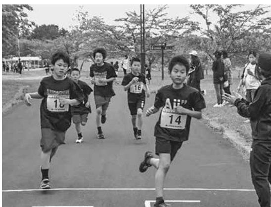
見事完走した児童