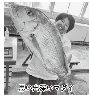
思い出深いマダイ