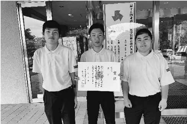
団体3位に入賞できました (ゴルフ部)

ご協力をいただいた施設や企業の方々には大変お世話になりました。おかげで生徒たちは貴重な体験をすることができました。感謝申し上げます。