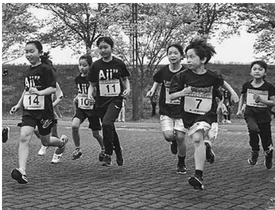
小学生女子スタートの様子