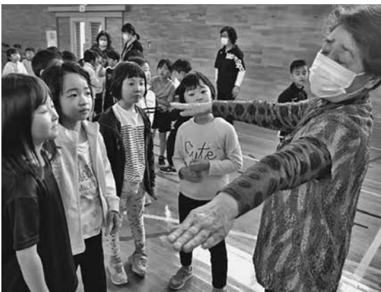
児童に指導する鱒ヶ沢無形文化財保存会会員