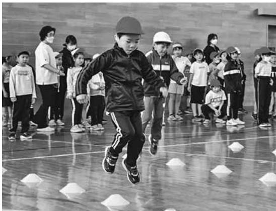
連続する障害物を飛び越える児童（舞戸小）