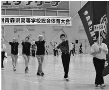
総合開会式での行進の様子