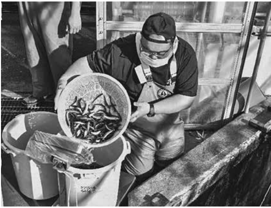
アユ稚魚積込作業の様子