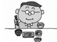
健やか力向上推進キャラクター 「マモルさん」