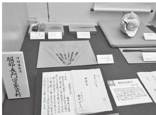
「光信公の館」には、服部家に江戸時代から伝わる由緒書や道具類などが多数展示されている