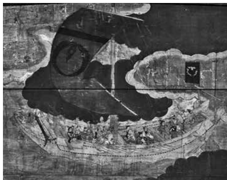
円覚寺に奉納された寛永10年の船絵馬 （『青森県史 資料編 近世2』より転載）