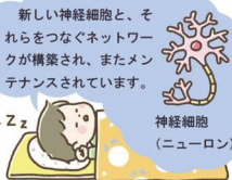
(厚生労働省 未就学児の睡眠指針より)