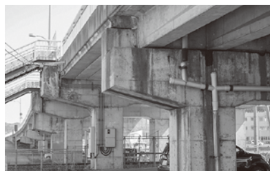
鱒ヶ沢跨線橋のようす