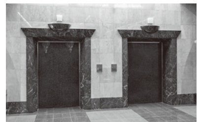
鱒ヶ沢町斎場火葬炉のようす

鱒ヶ沢町斎場の火葬炉(人体用2炉、砲衣・小動物各1炉)を改修。より安全に利用できる環境を整備します