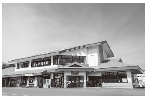
「海の駅わんど」のようす

意見・「海の駅わんど」の休業による経済損失を最小限にするため、工期短縮による早期復旧。また、修繕費用を投じるよりも、長期的な資産価値や利便性を考慮すれば、新設の方が合理的であり、営業の空白期間を生まない柔軟な対応を求めます。