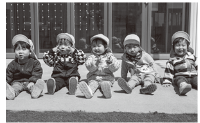
保育園児のようす

0歳児から2歳児までの保育料を無償化。これにより全ての保育児童の保育料を完全無償化にします