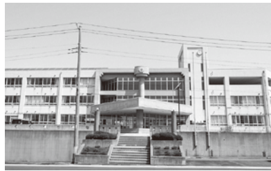
舞戸小学校のようす

舞戸小学校の増改築により『義務教育学校』の開校を目指し、今年度は施設的设计業務に着手します