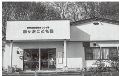
(仮称)歴史文化財センターのようす

旧鱒ヶ沢こども園を改修して『(仮称)歴史文化財センター』を整備。歴史資料などの適切な保存・管理をします