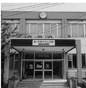
中央公民館大ホールの様子

次にメリットについてですが、第1点目、運営の効率化とサービス向上、第2点目、地域の特性を生かした施設活用の拡大、第3点目、行政資源の重点化であります。それらにより、町は社会教育事業の充実に注力できる体制となるよう整備を図るものです。