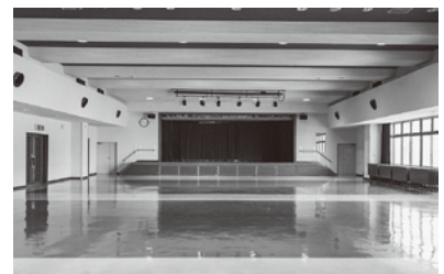
舞戸公民館大ホールのようす