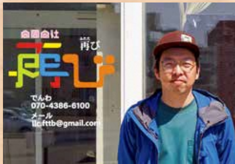
舞戸町 合同会社再び