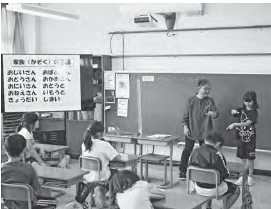
一緒に手話を練習する児童たち（西海小）