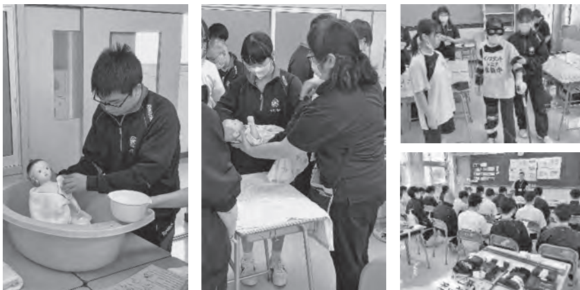
講義や実技の様子

9月17日、2年生を対象に「生と性を考える教室Ⅰ」を開催し、鰯ヶ沢町ほけん福祉課から7名の講師をお迎えしてご指導いただきました。生徒たちは「妊娠、出産について」「老人の特徴と主な介護用品について」の講義や妊婦疑似体験、育児技術体験、高齢者疑似体験などの実技を通じて、正しい性知識と命の大切さ、健全な父性母性について学ぶことができました。