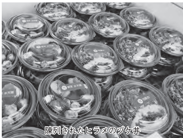
陳列されたヒラメのツケ丼