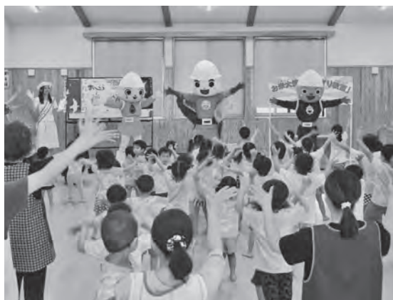
お米大使と「モリモリダンス」を踊る園児たち