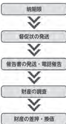
滞納処分のフロー図

税金を納期限までに納めないで滞納者となります。仮にうっかり忘れていたとしても、督促状が届くと督促料が発生し、本来納めるべき本税に加え、延滞期間に対して延滞金が増加されます。督促をしても完納されず、催告書や差押予告などが町から届いても納付されない場合は、法律に基づき滞納者の土地や建物などの不動産、自動車や貴金属などの動産、給与や預貯金などの債権といった財産に対して調査を行います。財産調査により差し押さえる財産が決定すると差押処分を執行し、差し押さえた財産を換価します。これを「滞納処分」と言います。