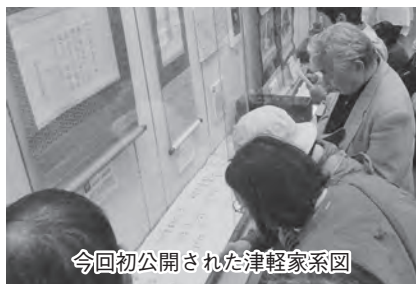
今回初公開された津軽家系図