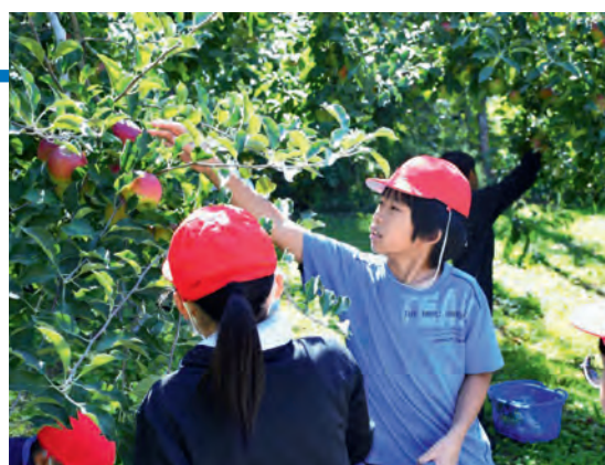
りんご収穫体験の様子

また、収穫作業の後には、老舗ベーカリーであるドンクの担当者から、県産りんごを使用したパンがお土産として児童たちに振る舞われました。