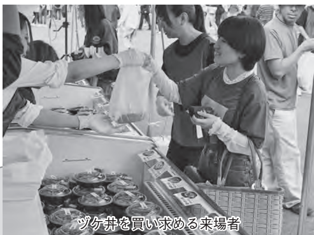
ツケ丼を買い求める来場者

10月5日、海の駅わんど向かい特設会場でヒラメのツケ丼、お肉、スイーツが一堂に会したグルメイベント「あじがさわフードフェス2025」を開催しました。