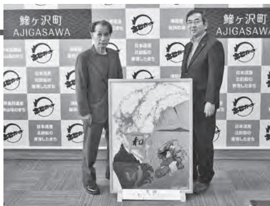
寄贈された青森ひば絵「和」と荒谷理事長（左）