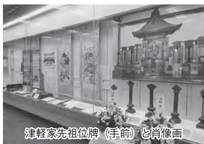
津軽家先祖位牌（手前）と肖像画