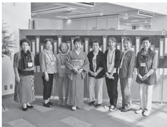
舞華書道会の皆さん