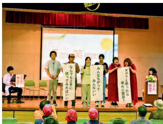
あじがさわ一座の「認知笑教室」