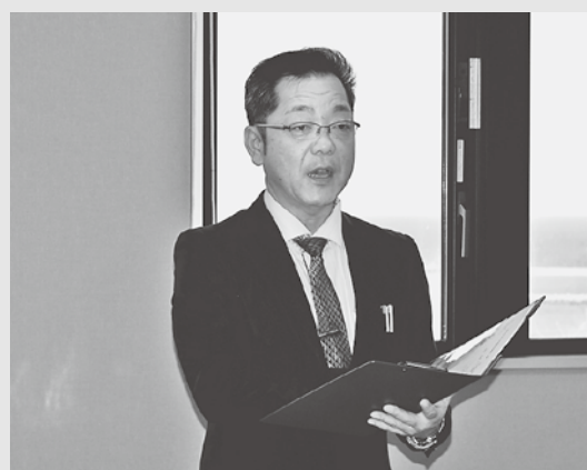
代表挨拶をする千葉校長