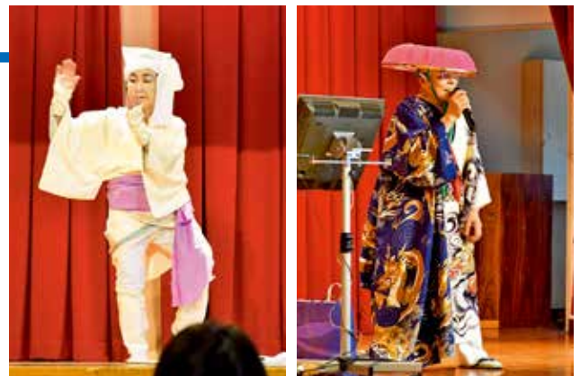
この日のために練習を重ねた歌や踊りを披露

また、発表会に先立ち「鱈ヶ沢町老人クラブ連合会表彰授与式」が行われ、11名に会長表彰が、2名に功労賞が贈られました。