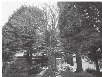
枯死したイチイ（令和5年7月）

地域の歩みを見守ってきた古木が、また一つ姿を消すことになりました。（町学芸員 中田）