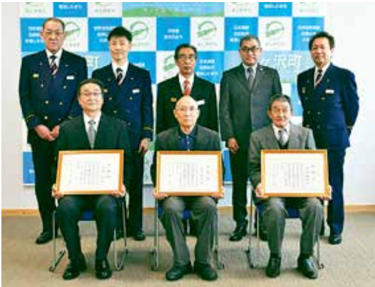
感謝状贈呈式に出席した3名（前列）