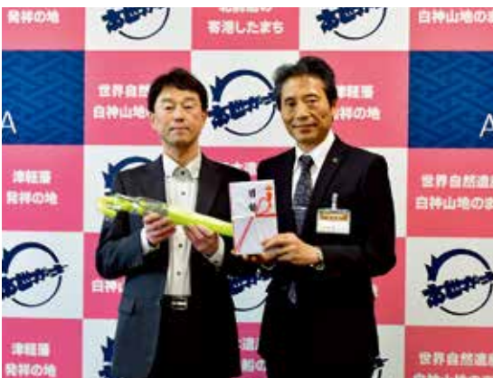
加藤会長（左）と阿彦教育長