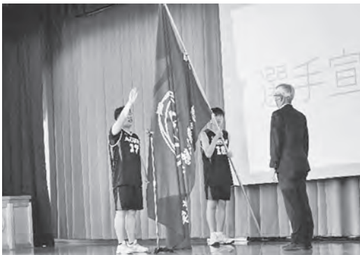
バスケットボール部主将による選手宣誓

最後まで諦めないで戦います。」と決意を述べました。応援団の主導で、全校生徒は熱のこもったエールを送り、校歌を斉唱して選手たちを激励しました。