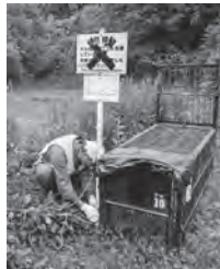
箱わなを設置する実施隊