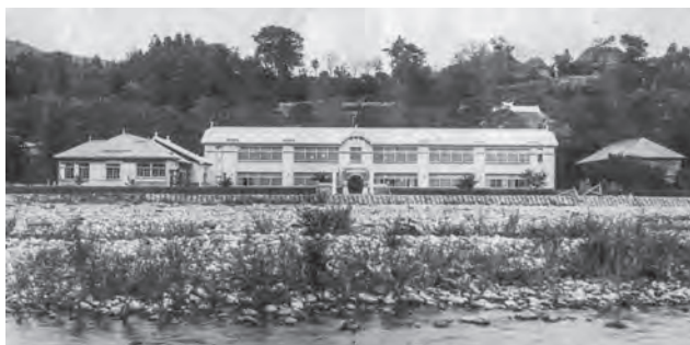
昭和4年に建築された南金沢小学校（昭和20年頃） 地域住民の熱意により建てられた、県下に誇る立派な校舎だった