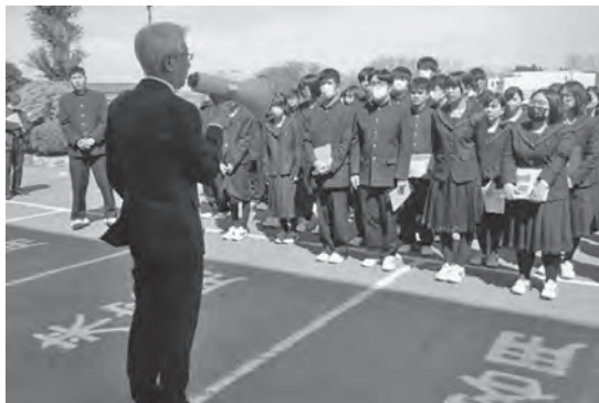
校長による避難状況の講評

■青森県立鯨ヶ沢高等学校 ☎0173-72-2106 HP : https://www.ajigasawa-h.asn.ed.jp/