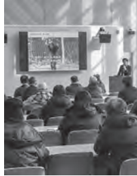
クマ対策研修会の様子