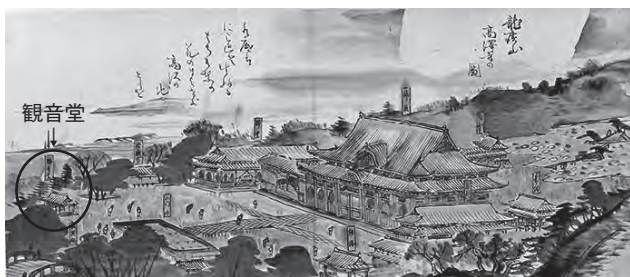
鱈ヶ沢町の学校教育発祥の地となった高沢寺観音堂 明治15年「蓑虫山人写画」より。現在は残っていない

■学校のはじまり 江戸時代、津軽藩御用港として発展してきた鱈ヶ沢町では、庶民の教育に対する関心も深く、多くの私塾・寺子