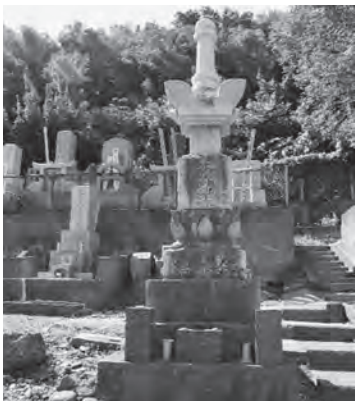
延寿院の明和地震供養塔 令和7年（2025）9月21日