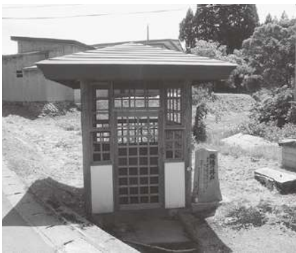
黒森にある「殿様の井戸」

そのため光信は、津軽内陸部から海岸には出ずに、岩木山南麓の山道を通って赤石川上流の種里城に入ったと考えられます。現在、専門家の間では、