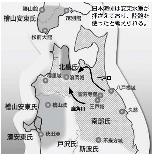
戦国時代の勢力圏と津軽への道

この時、南部氏による津軽派遣軍の司令官として選ばれたのが、下久慈の領主で当時32歳だった南部光信でした。光信には、久慈から350人の軍勢が従ったとされています。