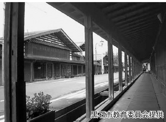
中町こみせ通り（国重要伝統的建造物群保存地区）