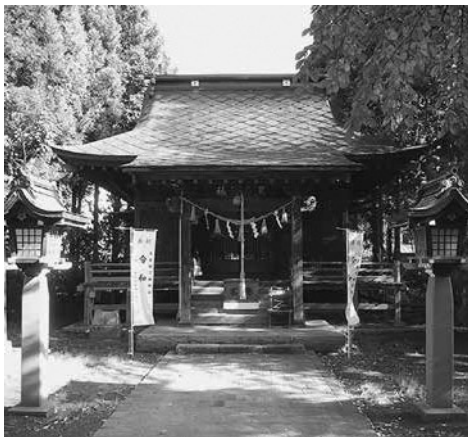
黒石神社（黒石市市ノ町）